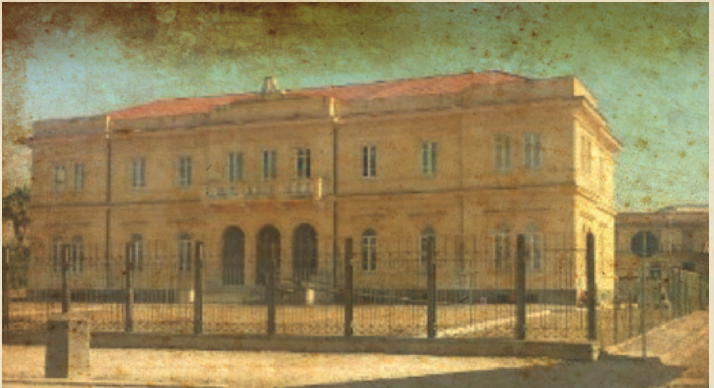
(Ex Municipio di Atella di Napoli)