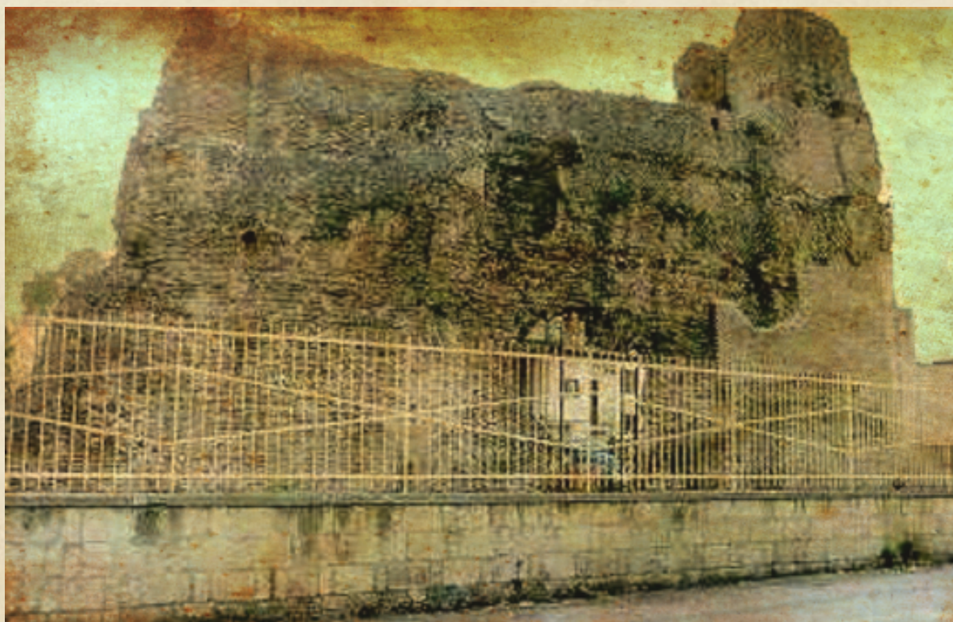
(Rudere Romano Castellone - mura romane)

cane cu arraggia!». Era utile a tenere i curiosi lontani, curiosi che potevano intralciare le profanazioni. Da quando non c'è più niente da prendere, lo scheletro di Castellone è stato dimenticato e la terra che lo circonda è diminuita inspiegabilmente, per far spazio a distributori di benzina e rivenditori di auto. Da tempi immemori, sempre la stessa storia.