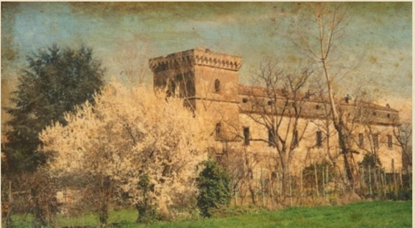
(Casale di Teverolaccio)

separati da tre imponenti redondoni toroidali, in tufo grigio, e coronata da una caditoia a beccatelli poggianti su mensole in calcare. Di grande interesse sono le cornici delle finestre, forse successive di qualche decennio rispetto al resto della costruzione, sempre in piperno, alcune delle quali recano i segni delle corte che servivano ad accedere ai diversi livelli della torre. Infatti, originariamente, essa non aveva accesso al piano terraneo. La torre è affiancata da un piccolo vano a pianta circolare che ospita una scala. Il lungo edificio continuo alla torre, che ancora conserva le mensole originarie rinascimentali, dove sorgere sotto il baronato del Palumbo, per poi essere sopraelevato (sottotetto con oculi e comignoli) probabilmente a metà del '700. Chiude la corte interna, in parte ad archi, l'altro edificio palaziale fu costruito tra il 1653 e il 1666.