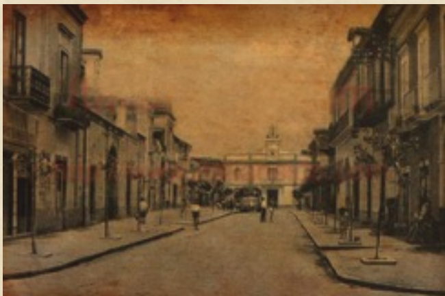
(Succivo - Corso Umberto I)

Sappiamo che la zona di Succivo fu oggetto di centuriazione all'epoca dei Gracchi, di Silla e Cesare e in età augustea. Persistono tracce evidenti di tutte e quattro le centuriazioni e il nome probabilmente rispecchia proprio la divisione del territorio in centurie.