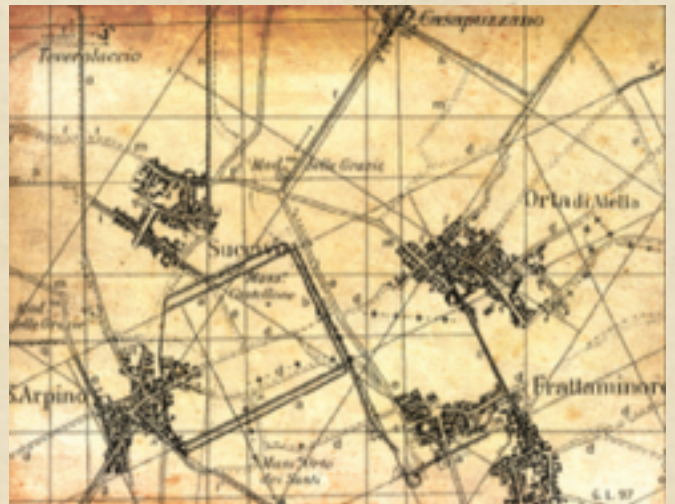
[Il sito dell'antica Atella, contornato dagli attuali comuni e con le tracce della centurazione (G. Libertini, Persistenze...)]

forse anche di un arco marmoreo e conobbe il suo massimo splendore. Fu questo il periodo in cui ospitò Virgilio e le sue scribenda Georgiche. Da quel momento Atella fu costellata di ville signorili e vide l'abbandono dei territori coltivati. Con l'avvento del cristianesimo fu sede vescovile e il primo vescovo sarebbe stato Canione, ormai santo.