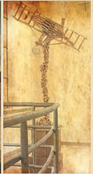
(Casa delle Arti di Succivo - Ex Casa del Balilla)

It was built during the twenty years of the fascist period and it was used as youth community centre. It was restored in the years 2000 and since then it has been used as the town council library to promote the cultural heritage of the area.