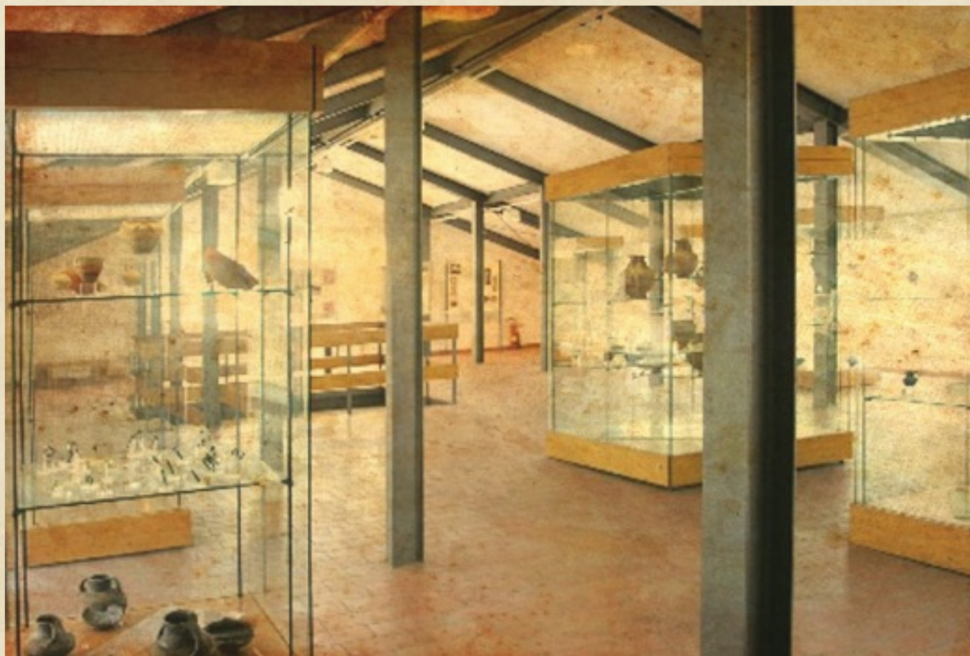
(Museo archeologico dell'Agro Atellano)

Campanus. Sono presenti: la ricostruzione di una necropoli con sepolture di bambini entro anfore, reperti databili dall'età del Bronzo, la collezione vascolare di vasi a figure rosse di produzione campana, mostre temporanee relative a scavi nel territorio, corredi di età orientalizzante provenienti da Gricignano. È dotato di apparati didattici e di postazione video.