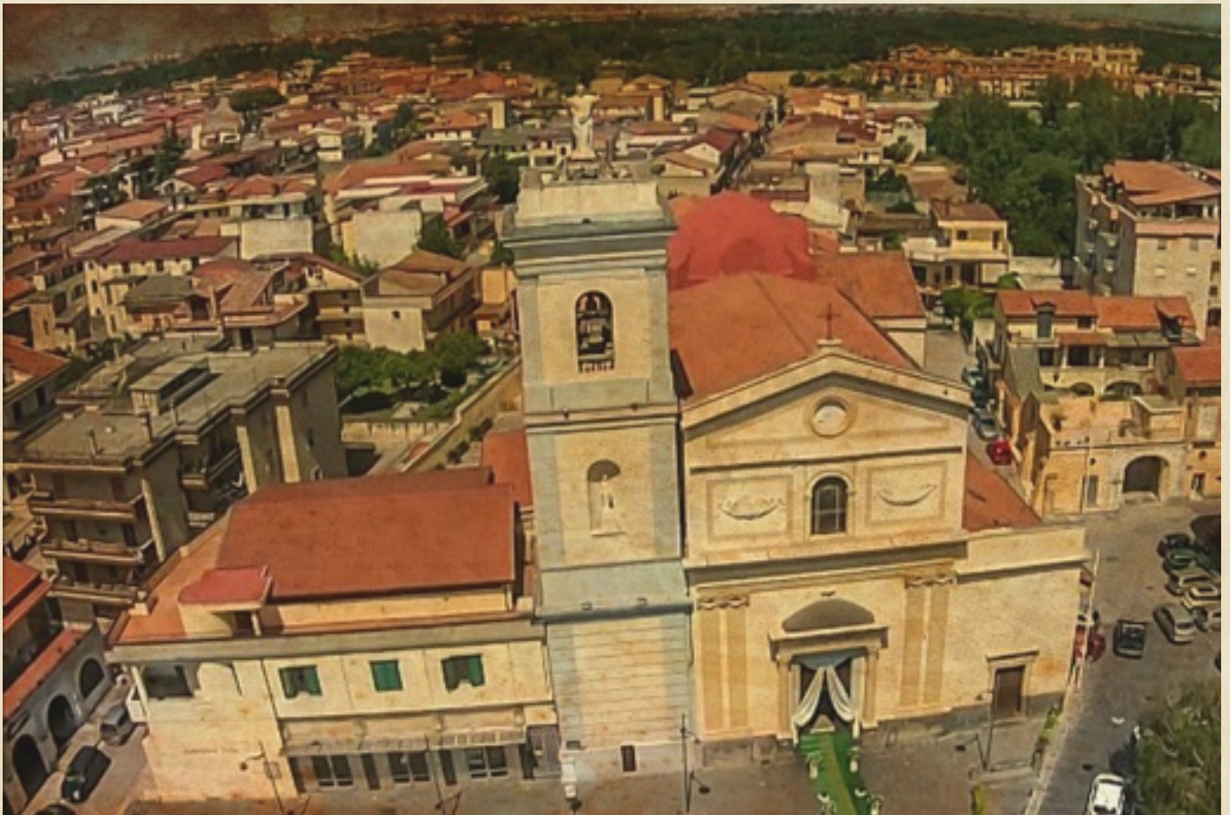
(Chiesa della Trasfigurazione)

estremità. La volta del catino absidale accoglie invece un affresco del raro pittore ottocentesco Achille Iovine, firmato e datato 1873, che è copia, niente affatto male, della Trasfigurazione di Gesù sul monte Tabor di Raffaello conservata negli appartamenti vaticani.